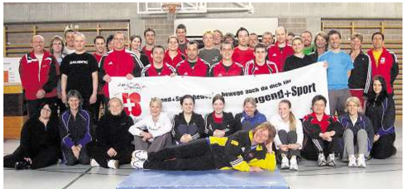
Vertrauen schaffen: Beim J+S-Modulkurs Turnen stand unter anderem auch «Gerätevarianten» auf dem Programm.

Die zahlreichen Leiter erfuhren in Schwyz viel Neues und Wissenswertes, welches sie ihren sportlichen Schützlingen vermitteln können.