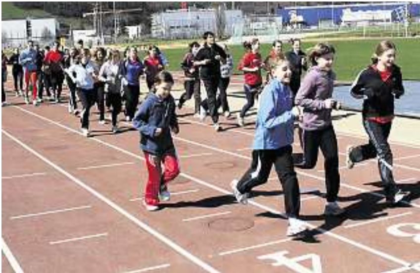
Zusammen trainiert: Über 40 Leichtathleten trainierten im Wintersried in Ibach unter den Augen hochkarätiger Gasttrainer.