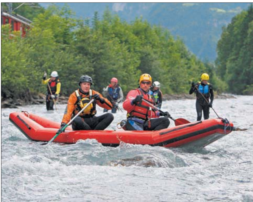
Mitglieder des Kanuzentrums Vierwaldstättersee gestern Nachmittag bei der Suche auf der Engelbergeraai.